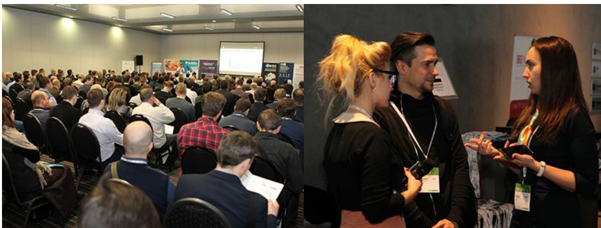
Міжнародний Гранд Форум ВІТ-2017 в Києві зібрав 551 учасника

Форум являє собою зручний майданчик для комунікацій , що об'єднує найбільш ініціативних представників вітчизняного ринку інформаційних технологій та телекомунікацій. Відзначимо, що в цьому році Форум відвідав 551 учасник!