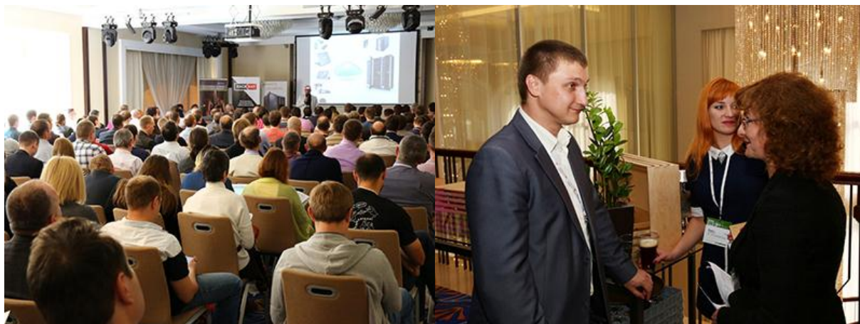
Международный Форум ВIT-2016 в Новосибирске собрал более 340 участников

Форум представляет собой удобную площадку для коммуникаций , объединяющую наиболее инициативных представителей отечественного телекоммуникационного рынка. Отметим, что в этом году форум посетили более 340 участников!