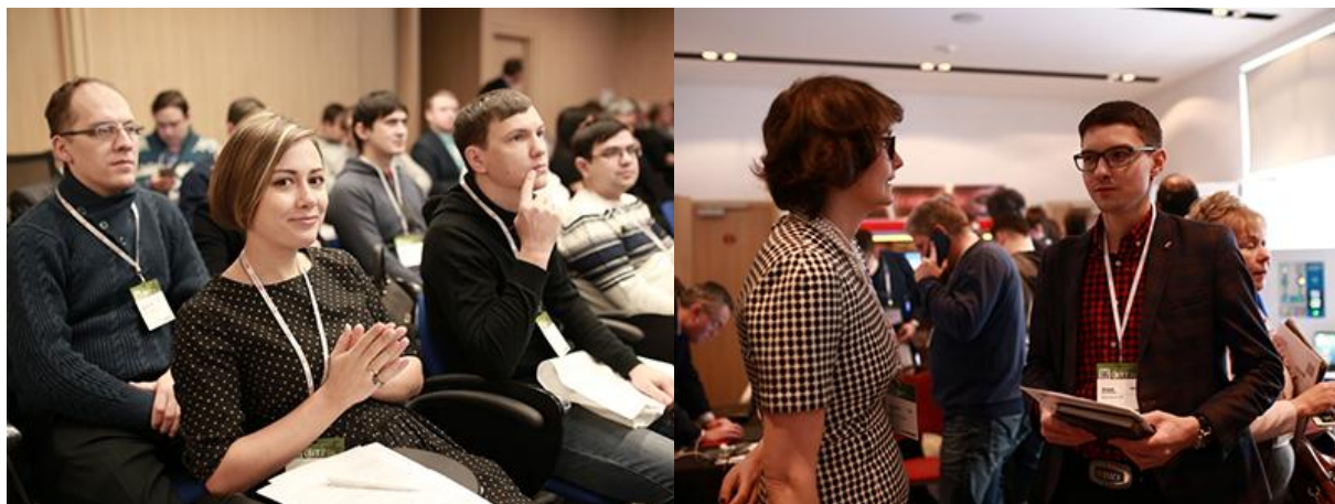
Международный Гранд Форум ВIT-2017 в Уфе собрал 223 участника

Форум представляет собой удобную площадку для коммуникаций , объединяющую наиболее инициативных представителей отрасли. Отметим, что в этом году форум посетили 223 участника!